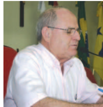
Jura durante trabalho na sessão

“Entendo que muitos servidores foram prejudicados e a minha solicitação é que esta correção seja feita de acordo com