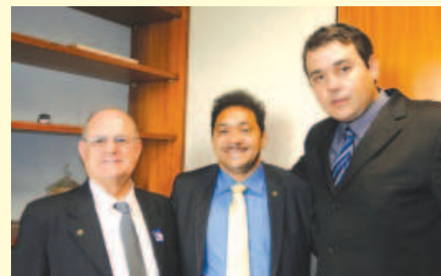
Deputado Tiririca (ao centro) diz aos vereadores que não apresenta emendas individuais para os municípios