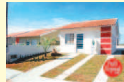
Abaixo e acima fotos das casas entregues pela CDHU em Potirendaba

Marmitão esteve representando a Câmara Municipal durante visita do