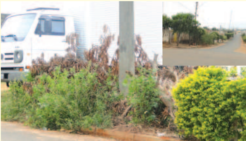
Mato, areia e sujeira tomam conta da rua e das calçadas em diversos pontos da cidade

Jura acrescenta que é público e notório que o bairro Nova Bady é o local onde ocorrem os maiores problemas de poeira, tendo em vista que um novo loteamento está sendo construído nas proximidades. “O prefeito precisa tomar providências colocando um caminhão pipa disponível diariamente no local para pelo menos amenizar a poeira nas ruas do bairro, ajudando a melhorar a qualidade de vida principalmente das crianças e idosos, pois a poeira causa sérios problemas respiratórios”.