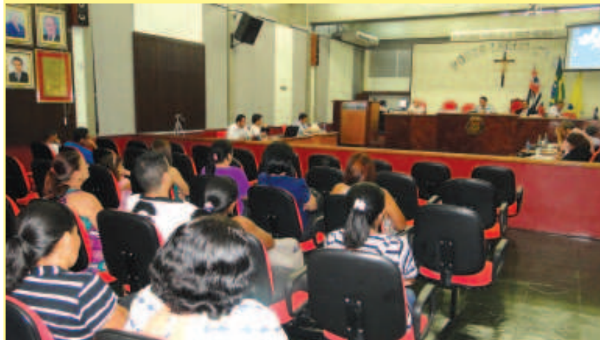
Público acompanha atentamente posicionamento dos vereadores na Câmara