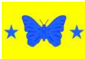
Bandeira de Bady Bassitt