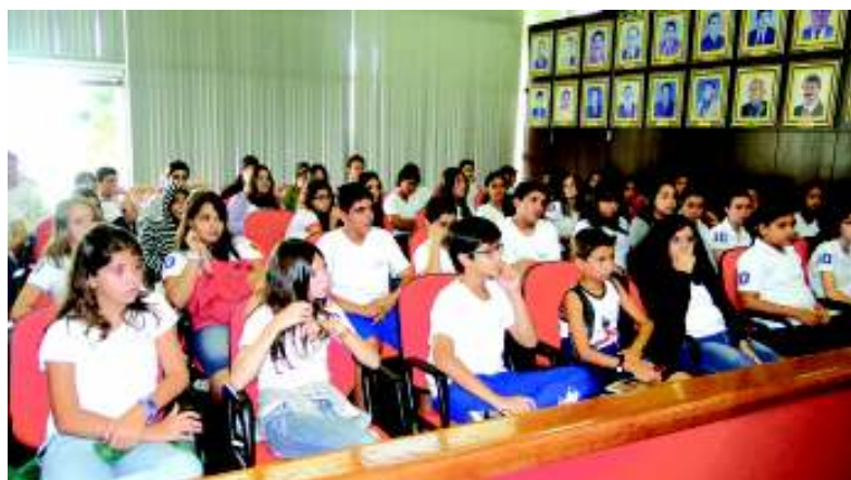
Alunos da escola Anglo durante visita à Câmara Municipal de Bady Bassitt

de alunos é muito importante, pois assim já começam a exercer seu papel de cidadão. "Iniciativas como estas são muito importantes para despertar o interesse da sociedade", afirmou. "Conhecendo como