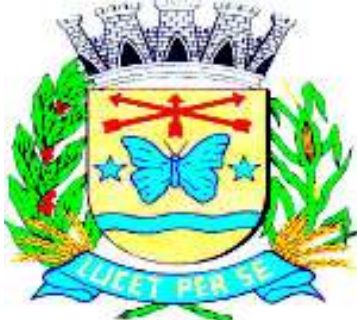
Brasão de Armas do Município

PRÓXIMAS SESSÕES: DIAS 7 e 20 de ABRIL DIAS 5 e 19 de MAIO