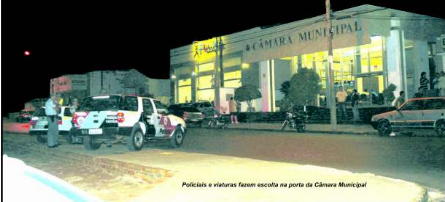
Policiais e viaturas fazem escolta na porta da Câmara Municipal